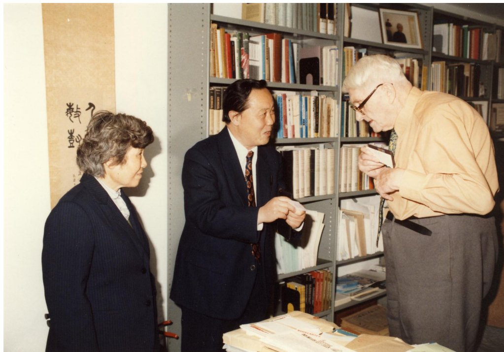
胡琳棣（左）马堪温（中）李约瑟（右） 1988年7月20日